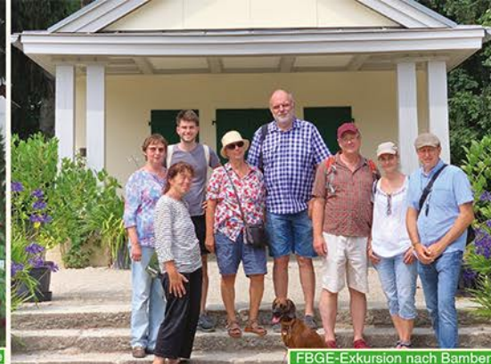
FBGE-Exkursion nach Bamberg