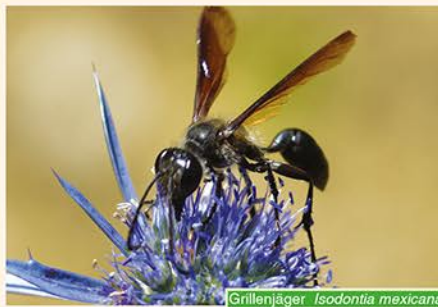
Grillenjäger Isodontia mexicana

Im Sommer fiel im Botanischen Garten besonders auf Wolfsmilchblüten eine ca. 2 cm lange schwarze Grabwespe auf, die Jürgen Schmidl als Isodontia mexicana bestimmte. Dieser Stahlblaue Grillenjäger stammt aus Amerika und wurde in Nordbayern erstmals vor 2 Jahren auf der Nürnberger Burg entdeckt. Als Brutkammern benutzt er interessanterweise oberirdische Hohlräume und röhrenartige Stengel, in denen die Weibchen dem Nachwuchs passende Grillen und Heuschrecken