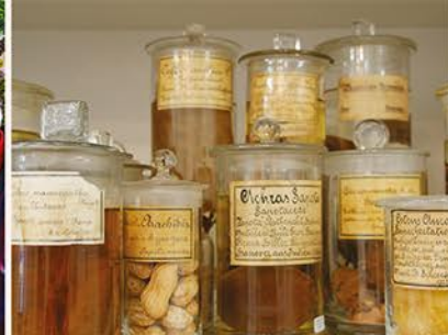
Zur Langen Nacht der Wissenschaften geöffnet: Die Botanische Sammlung im Verwaltungsgebäude...