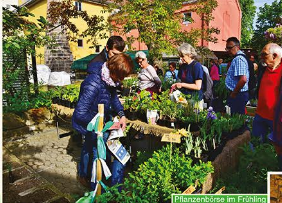
Pflanzenbörse im Frühling