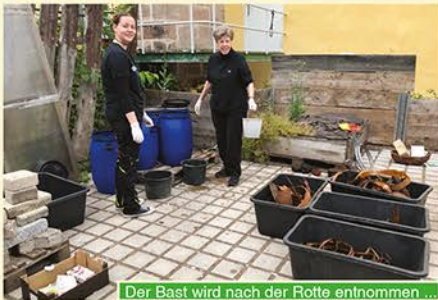
Der Bast wird nach der Rotte entnommen ...

Lindenbast ist ein unglaublich vielseitiger Werkstoff. Das haben auch die Menschen in der Jungsteinzeit gewusst. Dank der hervorragenden Erhaltungsbedingungen in