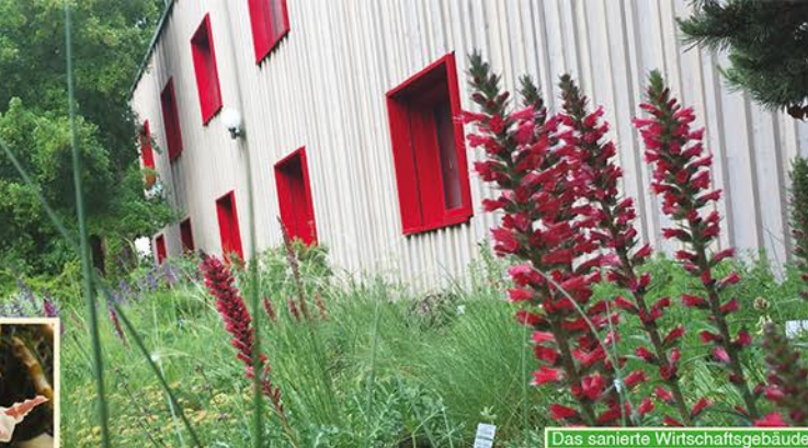
Das sanierte Wirtschaftsgebäude