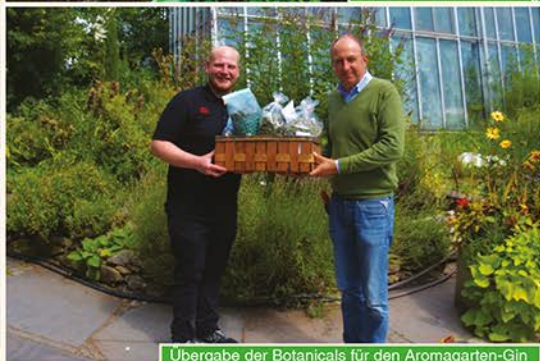
Übergabe der Botanicals für den Aromagarten-Gin