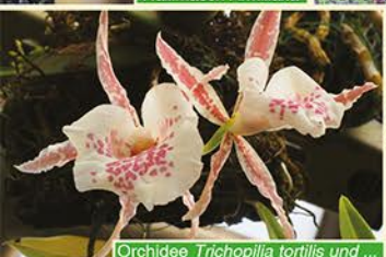
Orchidee Trichopilia tortilis und ...