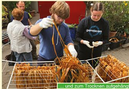
... und zum Trocknen aufgehängt

Lindenbast machen. Mitte Mai rückten insgesamt sechs Studierende zusammen mit zwei Dozenten aus, um die Rinde von drei großen, frisch abgesägten Lindenästen zu schälen, die ein in Bauer aus Simmelsdorf-St. Helena freundlicherweise zur Verfügung gestellt hatte. Der Zeitpunkt war genau richtig gewählt: Die Linde stand voll im Saft und die Rinde ließ sich leicht lösen. Im Botanischen Garten durften wir dankenswerterweise fünf kleine Regentonnen aufstellen. Darin rottete die Rinde vollständig mit Wasser bedeckt insgesamt acht Wochen. Der Rot-