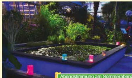
Abendstimmung am Sommerabend

Auch in diesem Jahr lädt der Botanische Garten zum beliebten Sommerabend. Ab 18:30 gibt es kurze Führungen durch den Garten und ab 19:30 unterhält die 'Profs Night Big Band Selection mit Daggi Krauß' mit einem