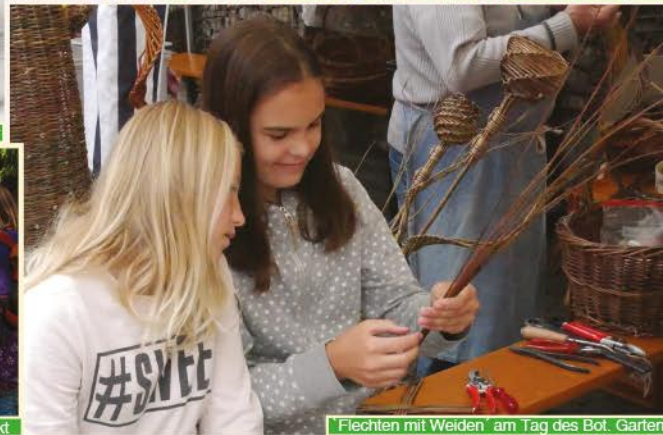
Flechten mit Weiden am Tag des Bot. Garten