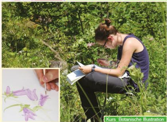
Kurs 'Botanische Illustration'