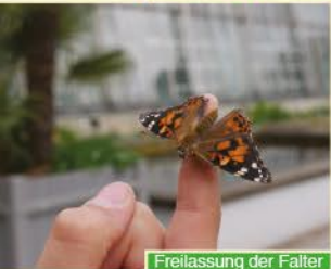
Freilassung der Falter