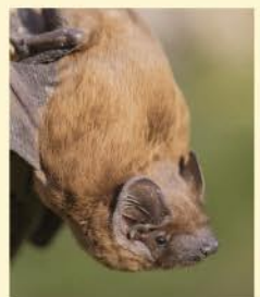
Kl. Abendsegler

Fledermäuse sehen mit den Ohren und fliegen mit den Händen. Aber wo leben sie und was fressen sie? Bei einem Abendspaziergang durch den Botanischen Garten werden wir mehr über diese nachtaktiven Säugetiere erfahren und sie hoffentlich bei ihren Jagdflügen beobachten können. In der Neischl-Höhle