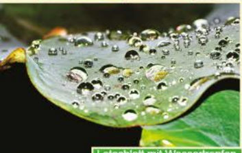
Lotosblatt mit Wassertropfen