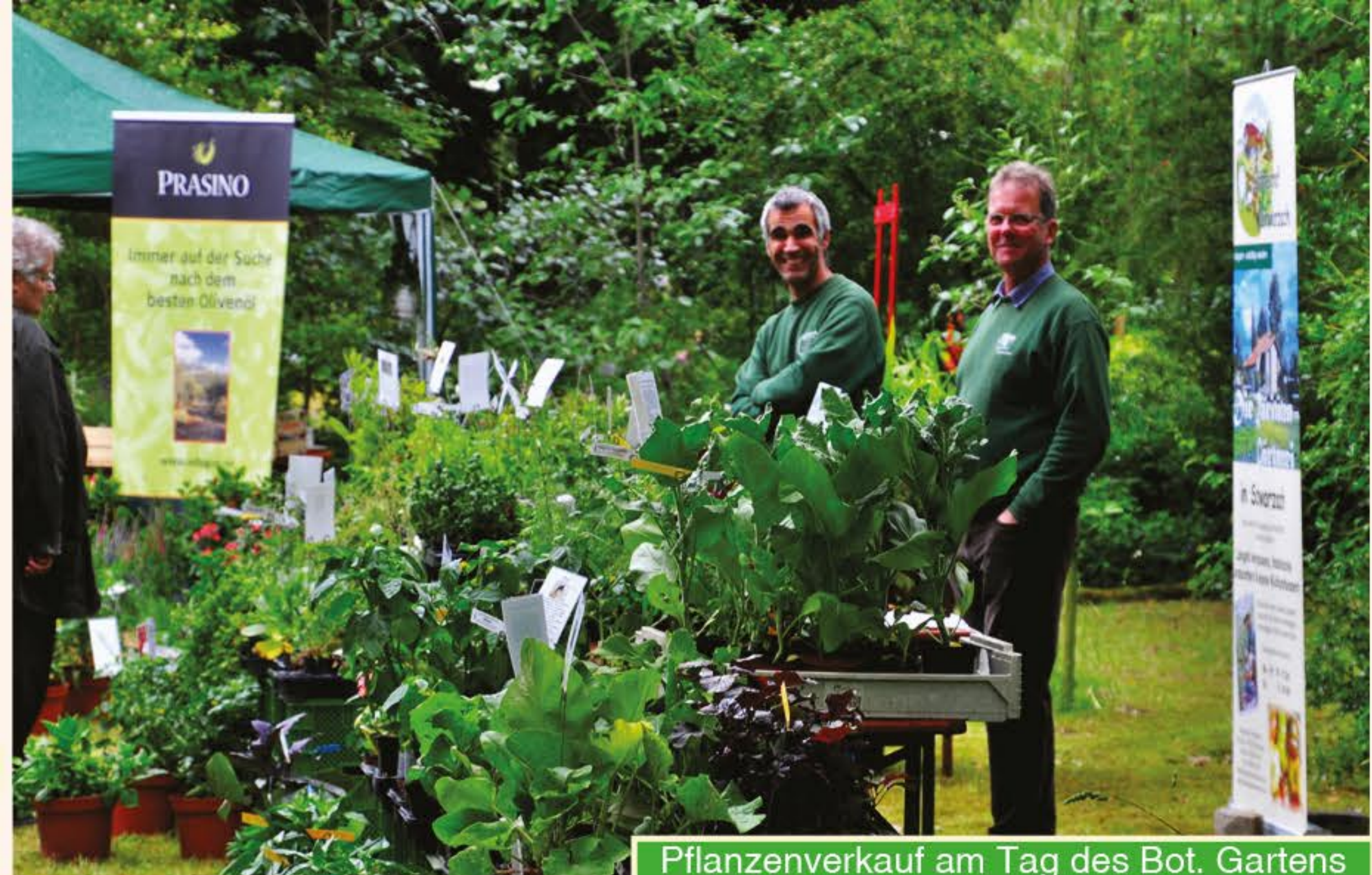
Pflanzenverkauf am Tag des Bot. Gartens