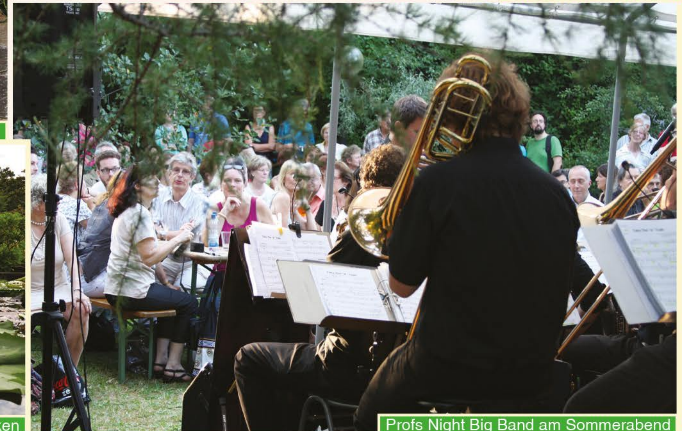
Prof's Night Big Band am Sommerabend