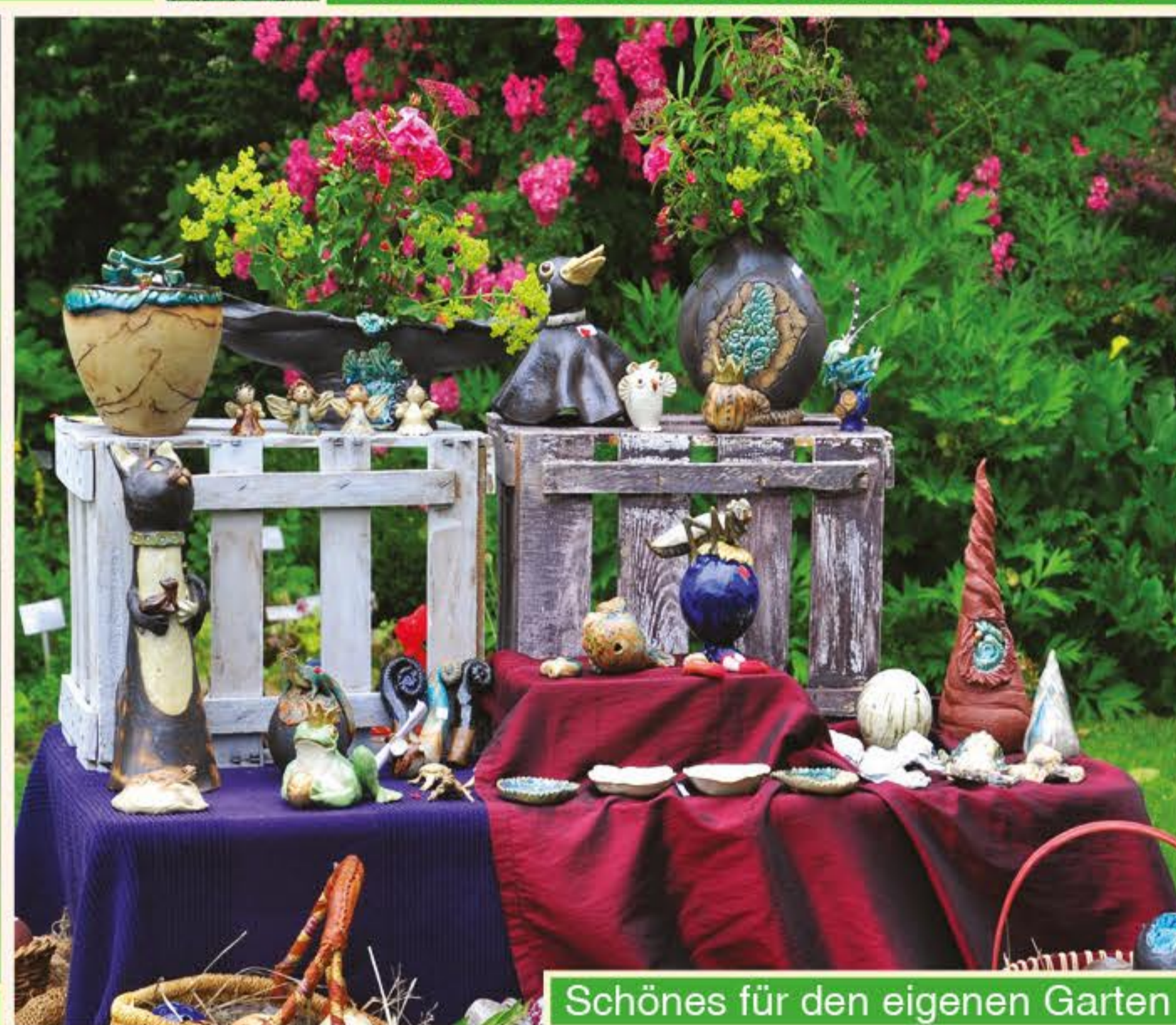
Schönes für den eigenen Garten