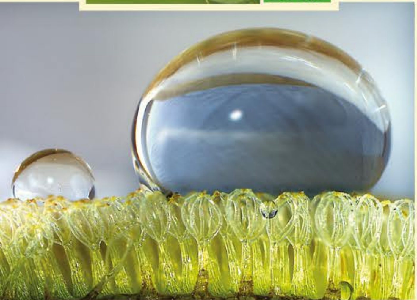
Schwimmfarn Salvinia