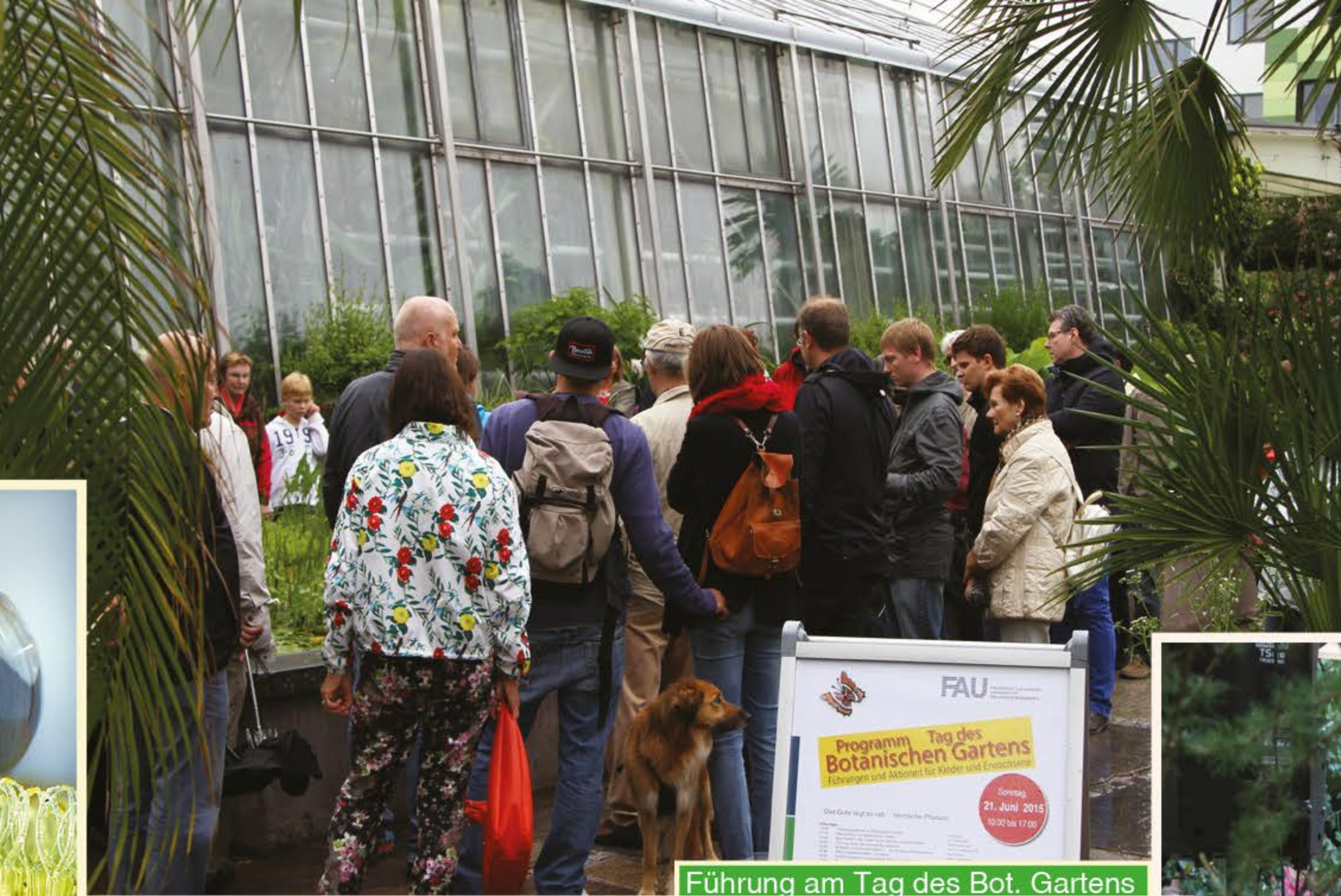
Führung am Tag des Bot. Gartens