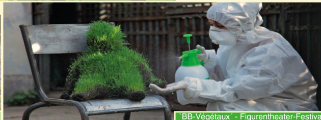
BB-Végétaux - Figurentheater-Festival