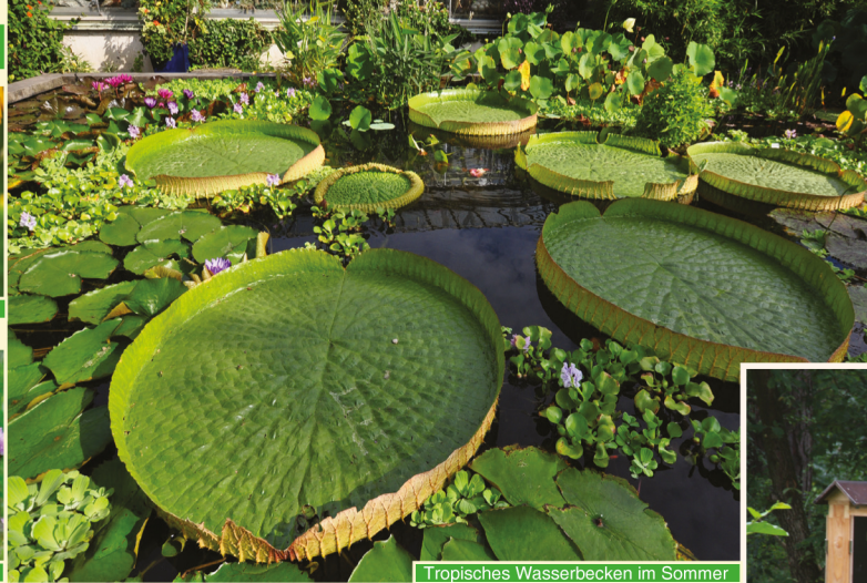
Tropisches Wasserbecken im Sommer