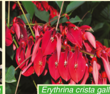
Erythrina crista galli

So 14.6. 11:00 Exkursion im Rahmen der BayernTour Natur zum Landschaftspark Dennenlohe Mit dem Bot. Garten Erlangen und der Naturschutzbehörde der Reg. v. Mittelfr. unterwegs. Es werden seltene Pflanzen und deren Lebensräume sowie ein interessanter Landschaftspark vorgestellt. Treffpunkt: Parkplatz Dennenlohe 1, 91743 Unterschwaningen