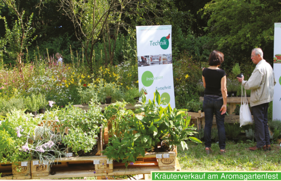
Kräuterverkauf am Aromagartenfest