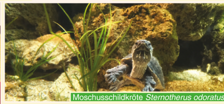
Moschusschildkröte Sternotherus odoratus