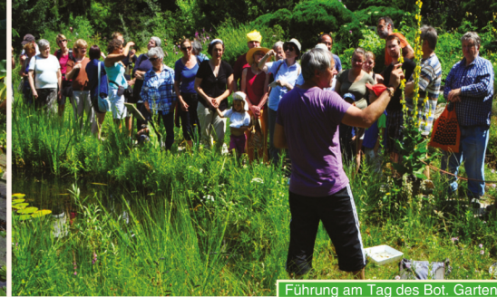
Führung am Tag des Bot. Garten