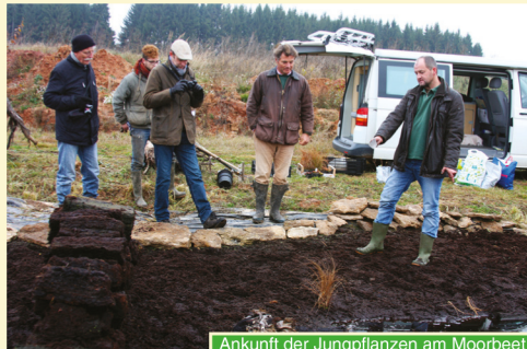
Ankunft der Jungpflanzen am Moorbeet

Bei einem Spaziergang durch den Landschaftspark von Schloss Dennenlohe wird die Kooperation des Botanischen Gartens der Friedrich-Alexander-Universität Erlangen-Nürnberg mit der Gartenverwaltung des Freiherrn von Süsskind und der Naturschutzbehörde der Regierung von Mittelfranken vorgestellt. Zur Rettung bedrohter Wildpflanzenarten werden im Botanischen Garten Erhaltungskulturen von regionalen Farn- und Blütenpflanzen angelegt. Diese sind Teil konkreter Naturschutzprojekte, wie beispielsweise dem Botanischen Artenhilfsprogramm Mittelfranken oder dem Artenhilfsprogramm für bedrohte Farn- und Blütenpflanzen in Niederbayern. Um die Bestände dieser Arten zu sichern,